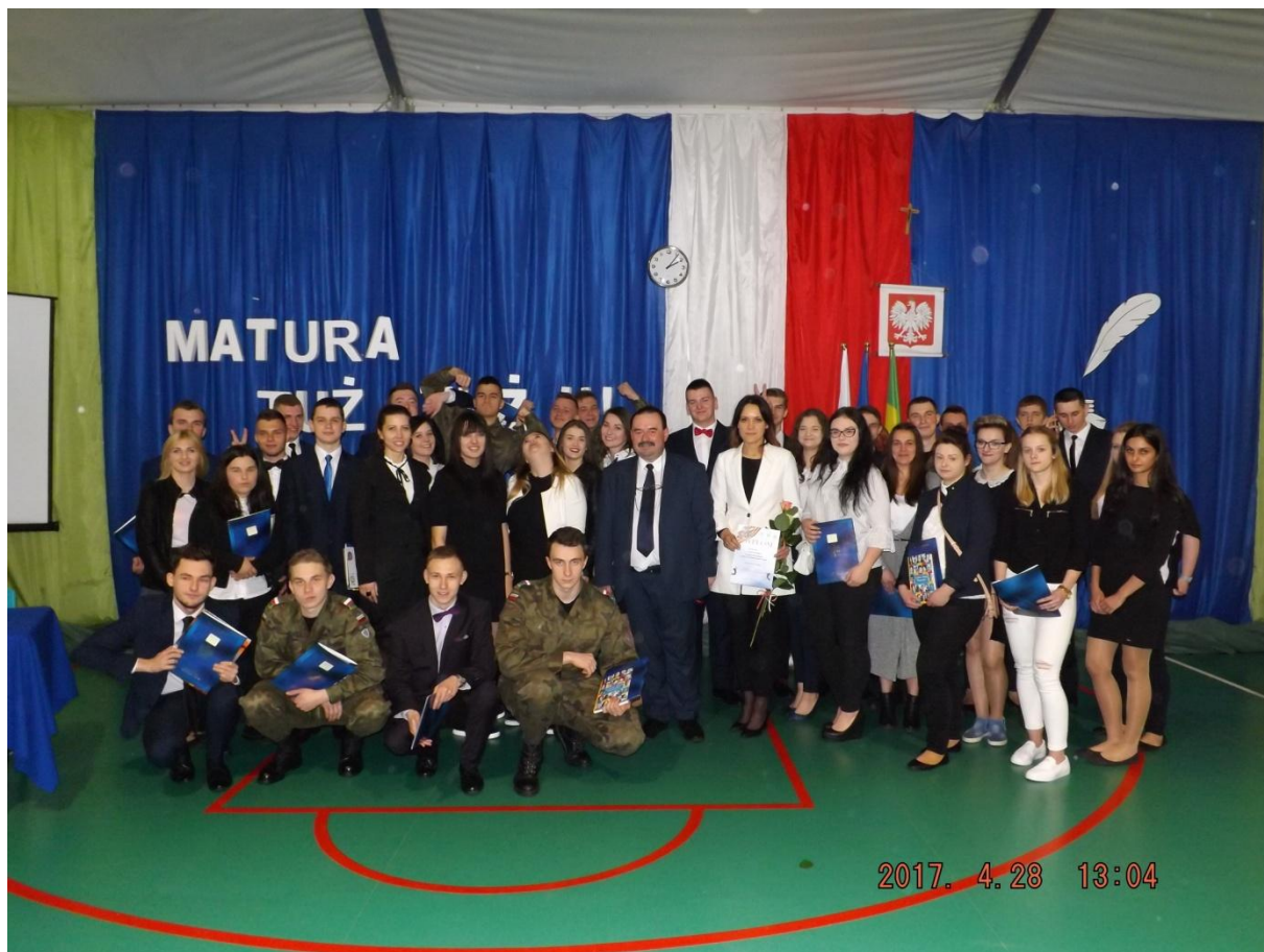
Maturzyści rocznik 2017