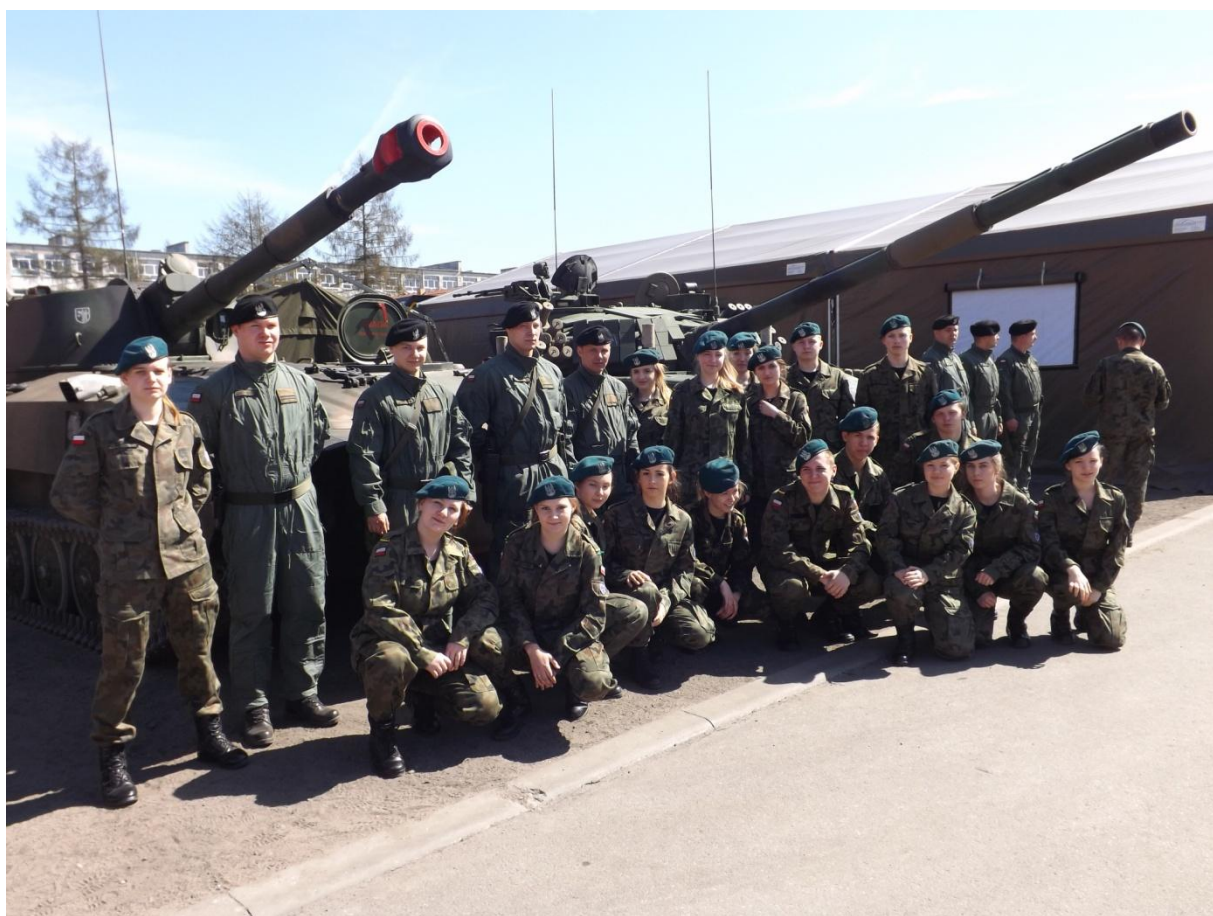
Z wizytą z Ośrodka Szkolenia Poligonowego Wojsk Lądowych w Bemowie Piskim - przekazanie zmiany Batalionowej Grupy Bojowej NATO.