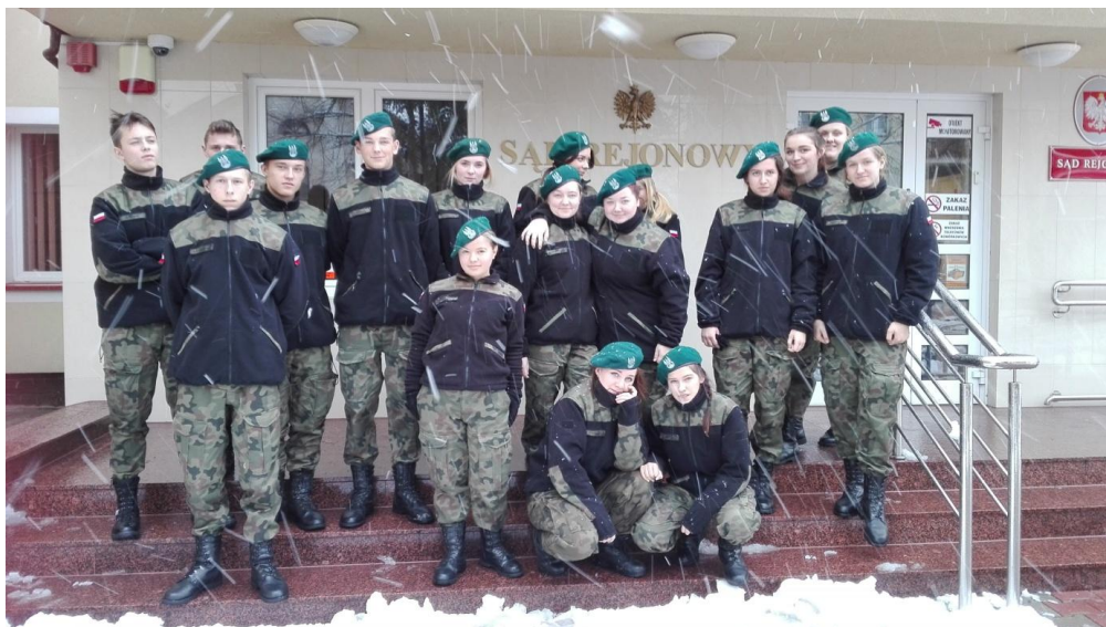
Klasa mundurowa z wizytą w Sądzie Rejonowym w Ostrołęce

W latach 1994- 2019 II SLO w Ostrołęce ukończyło 1205 absolwentów. Najczęściej wybierane kierunki studiów w systemie dziennym i zaocznym to: dziennikarstwo, pedagogika, anglistyka, marketing, prawo, polonistyka i obecnie służby mundurowe. Uczniowie kształcą się na studiach wyższych państwowych i prywatnych uczelni, na terenie przede wszystkim Olsztyna, Warszawy, Łomży, Białegostoku, Krakowa, Gdańska a także Ostrołęki.