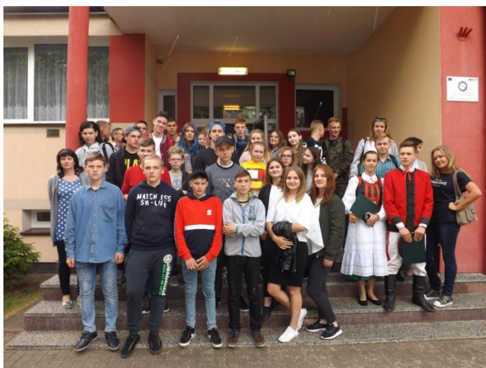
Młodzież z polskiej szkoły partnerskiej w ramach projektu MEN: "Rodzina polonijna..."