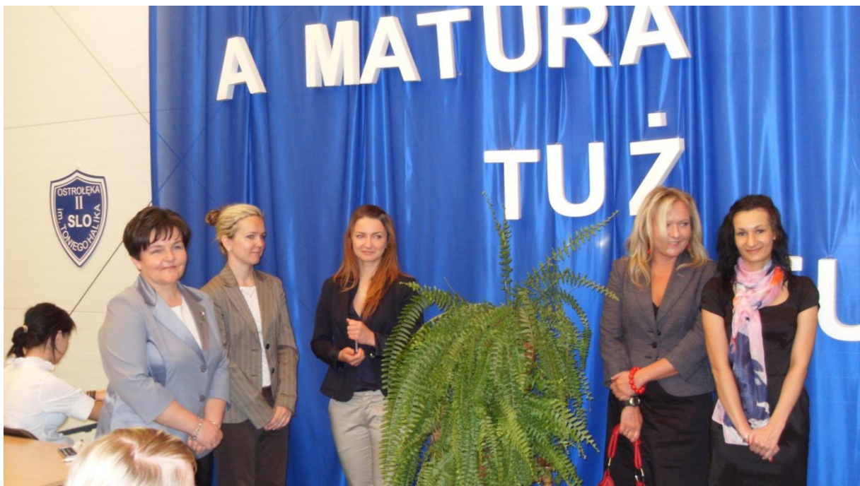
Rozpoczęcie egzaminu maturalnego w 2012 roku