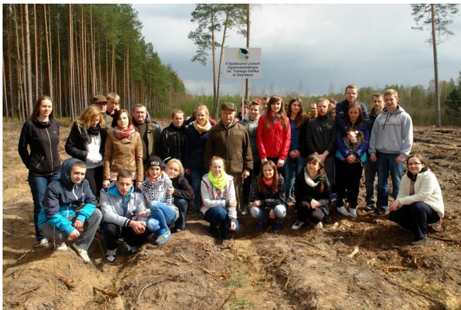
Sadzenie Lasu Pamięci z okazji 20-lecia szkoły