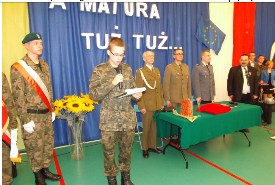
Zakończenie roku szkolnego 2012/2013