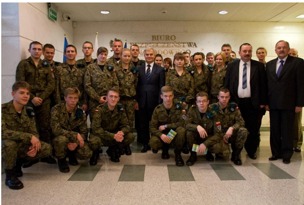
W Biurze Bezpieczeństwa Narodowego w Warszawie