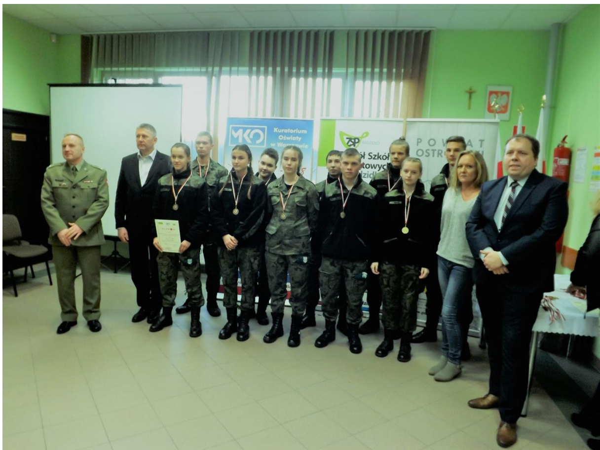
Zawody probronne o "O srebrene muszkiety"