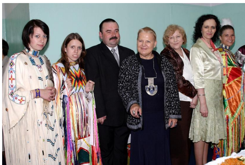
Obchody 15-lecia szkoły

1993 - wyróżnienie od Telewizji Polskiej za cykl Pieprz i wanilia oraz nagroda Pulitzera dla NBC za cykl programów o Kubie 13 .