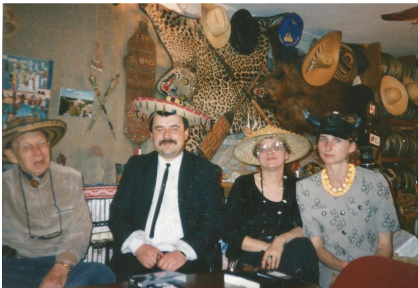
Spotkanie nauczycieli w Międzyzlesiu.