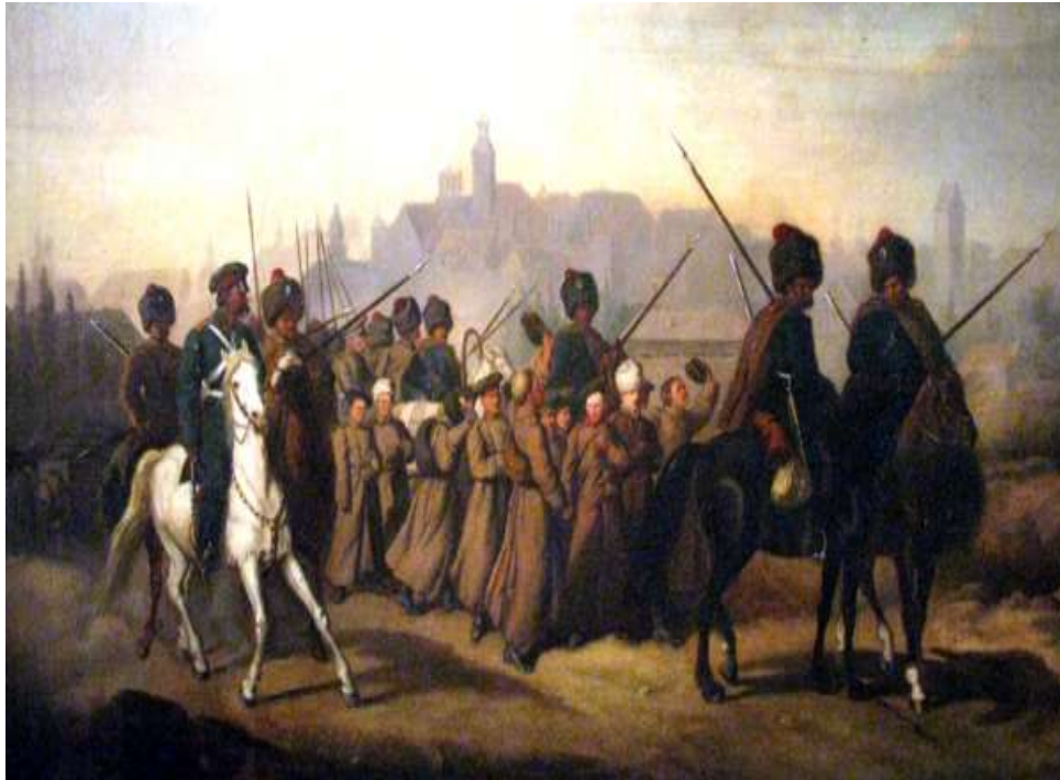
Branka - tragedia młodych konspiratorów

W 1874 roku zniesiono urząd namiestnika, a w 1886 zlikwidowano Bank Polski. Skasowano klasztory katolickie w Królestwie, skonfiskowano ok. 1600 majątków ziemskich i rozpoczęto intensywną rusyfikację ziem polskich. Klęska tego największego narodowego powstania była ogromnym wstrząsem dla Polaków.