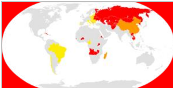
obchody Święta Kobiet na świecie

święto oficjalne ■ święto dla kobiet ■ święto nieoficjalne ■